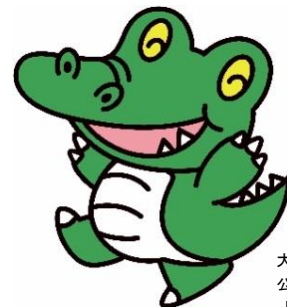
大阪大学 公式マスコットキャラクター 「ワニ博士」