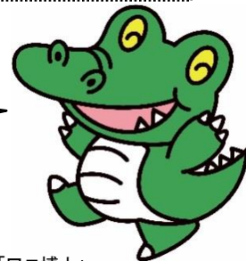
大阪大学「ワニ博士」