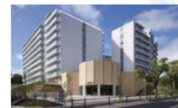
大阪大学グローバルビレッジ津雲台

入寮においては個別の状況により必ずしも希望に添えるとは限りませんが、事前に相談することが可能です。詳細は財務部資産管理課ハウジング運営係までご相談ください。