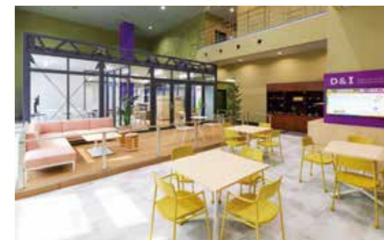
ダイバーシティ&インクルージョンスペース

※イベント等で占有利用を希望する場合は希望日の5営業日前の17時までにご相談ください。