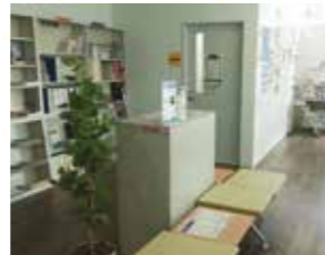
キャリアセンター豊中キャンパス

キャリアセンターでは、1回あたり40分以内での個別相談を行っており、「進路・就職相談予約システム（ https://cs-web.osaka-u.ac.jp/soudan/student/ ）」にて予約することができます。キャリアのことでSOGIに関する不安や悩みを相談したいときは、1人で抱え込むことなく、一度キャリアセンター（ cs-stu@ml.office.osaka-u.ac.jp ）へ連絡してください。研修等を受講した、または実際に対応経験のあるアドバイザーを紹介することができます。多様なセクシュアリティがあることを前提に、一人ひとりが力を発揮できるよう、本学は支援します。