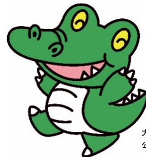
大阪大学 公式マスコットキャラクター 「ワニ博士」