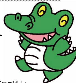
大阪大学「ワニ博士」